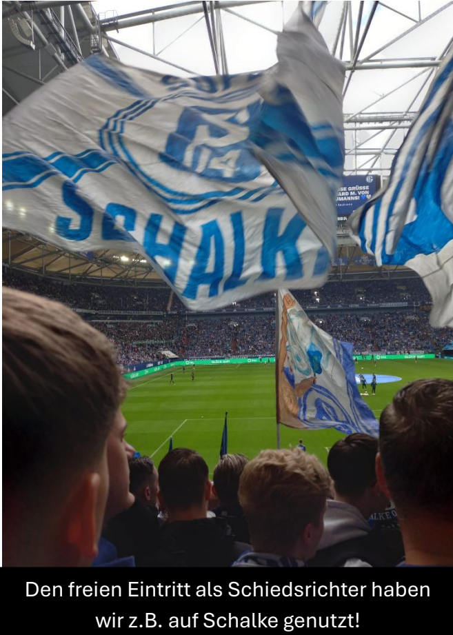
Den freien Eintritt als Schiedsrichter haben wir z.B. auf Schalke genutzt!

Konnten wir Euer Interesse an der Schiedsrichterei wecken? Das Hobby als Schiedsrichter bringt Bewegung, Spaß und viele neue Kontakte mit sich. Man kann in jeder Altersstufe dem Fußball verbunden bleiben. Zudem bekommt man für jedes geleitete Spiel eine Aufwandsentschädigung und freien Eintritt bei jedem Fußballspiel des DFBs (solange der Vorrat an Schiedsrichterkarten reicht, auch in den Profiligen).