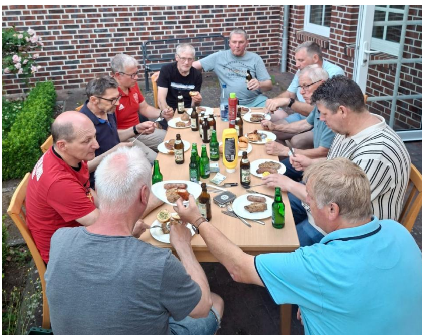
Nach dem Training am Donnerstag

Neben den sportlichen Aktivitäten kam auch die Geselligkeit nicht zu kurz. Im Oktober wurde ein gemeinsames Event auf dem Sportplatz organisiert. Nach einem