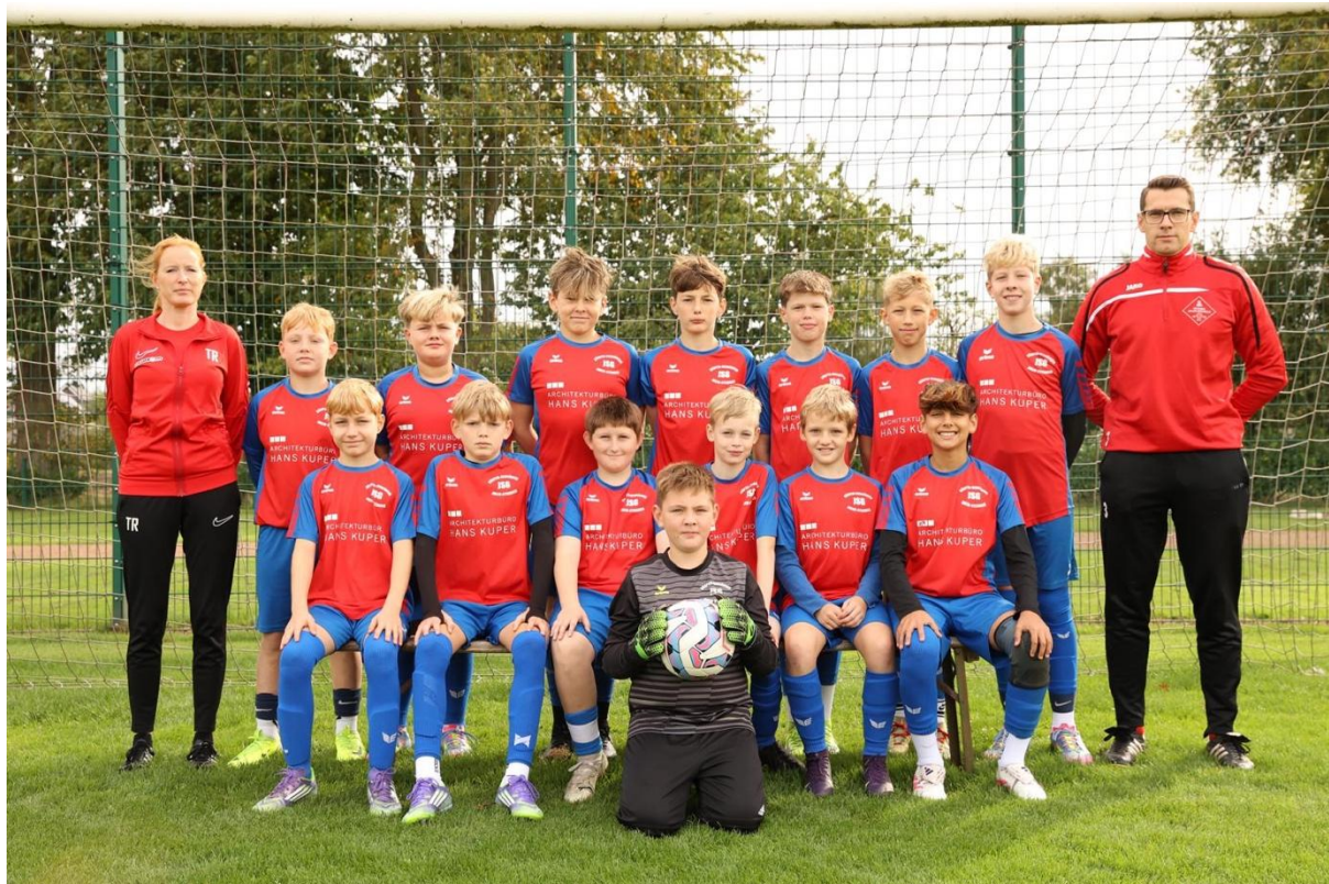
Hervorgehoben sind die Namen der Spieler des SV Neubörrer