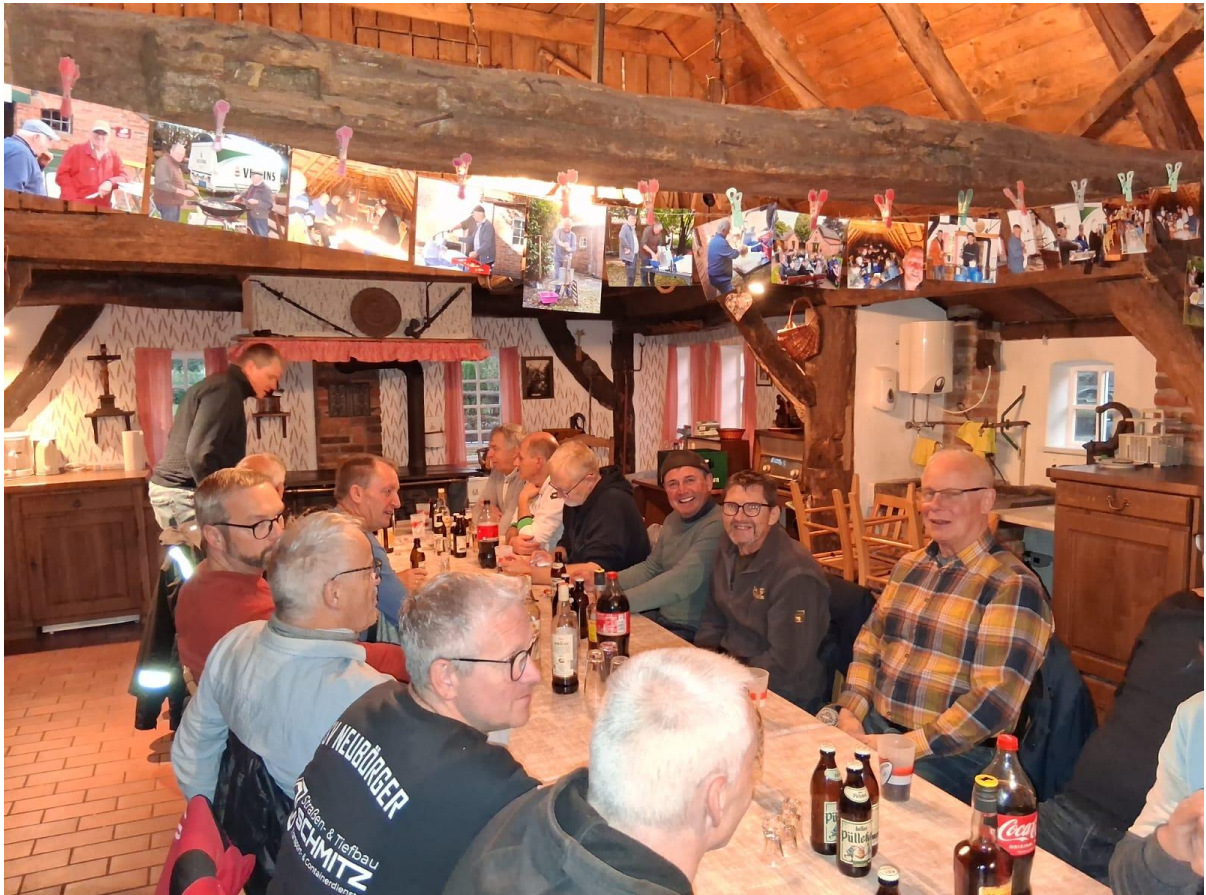
Im Oktober feierte die Altliga in gemütlicher Runde im „Schultes Hus“

Ein weiterer fester Bestandteil des Jahresprogramms war die Generalversammlung im Januar. Bei dem traditionellen Schnitzeessen wurde nicht nur auf das vergangene Jahr zurückgeblickt, sondern auch das Organisationsteam neu gewählt.